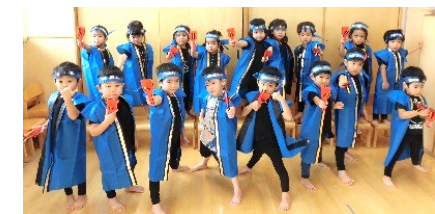
よさこいチーム フィンガーチーム いざ出陣！