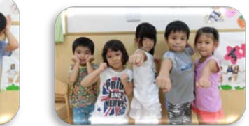
アンパンマングループ