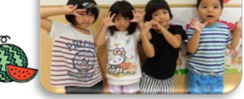
ゲゲゲのきたろうグループ