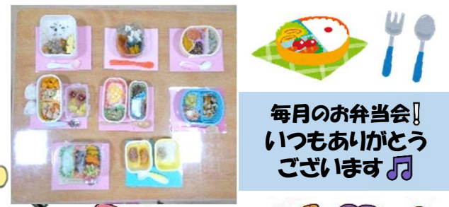
毎月のお弁当会! いつもありがとうございます♪