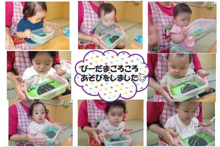
ビーだまころころあそびをしました◎

〇夏を健康に過ごし、ひとり一人の体調に合わせながら遊ぶ。 〇保育者と一緒に遊んだり、見守られながら好きな遊びを楽しむ。