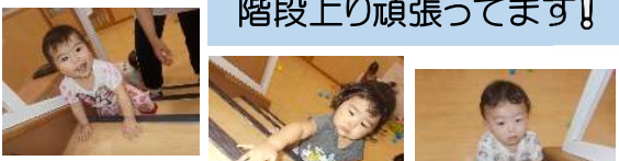
階段上り頑張ってます!!